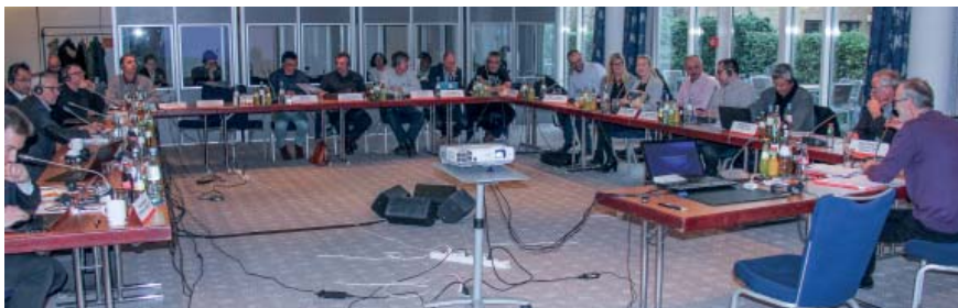
Information und Dialog: Die Europäische Projektgruppe auf dem Kick-off Meeting