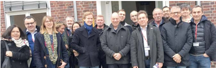
Europäische Gewerkschafts-Kooperation: Die CHANGE – Projektpartner am 09. Februar 2016 bei Airbus in Hamburg.

Die Ergebnisse aus der Umfrage liefern prioritäre Ansatzpunkte für betriebliche Gestaltungsmaßnahmen in den Unternehmen. Die damit verbundenen Handlungsfelder werden auf dem Europäischen Workshop im September 2016 im Hinblick auf konkrete Maßnahmen weiter bearbeitet.