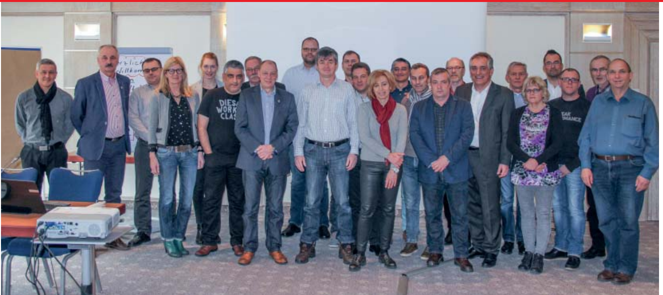
Teilnehmende am Europäischen Auftakttreffen am 10. März 2016 in Potsdam (DE)